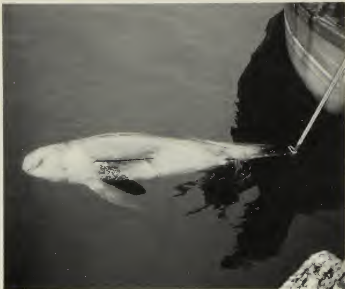
Fig. 4 – Il grampo ( Grampus griseus ) recuperato dal Museo di Storia Naturale di Milano il 26 maggio 1990.